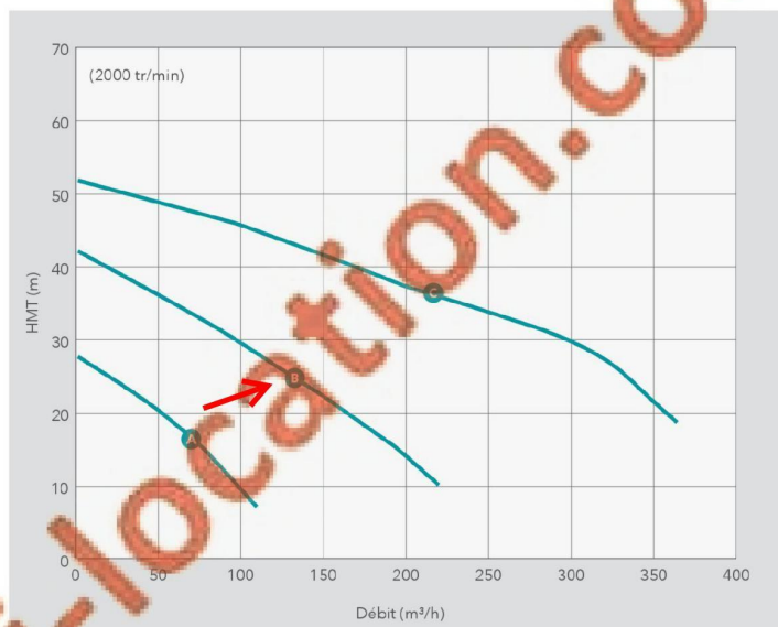
A NC80 B NC100 C NC150 Courbes commerciales, pour comparaison uniquement. Prière de consulter les notices techniques pour les valeurs exactes du débit et de HMT.